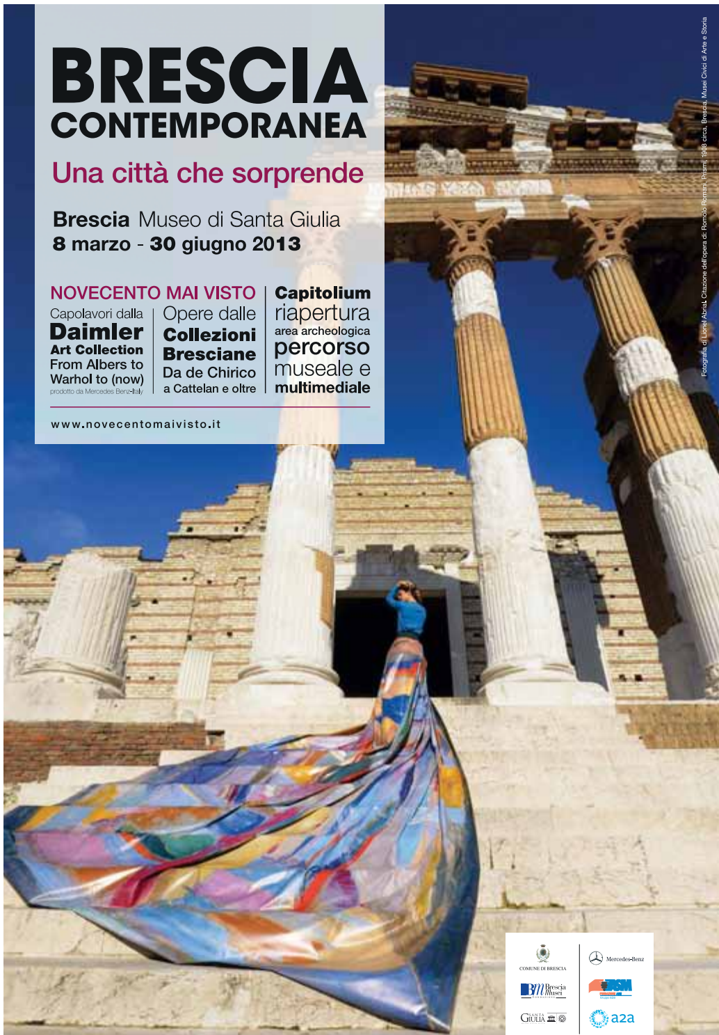
Citazione dall'opera di Romolo Romano, "Brescia", 1988 circa. Brescia, Musei Civici di Arte e Storia